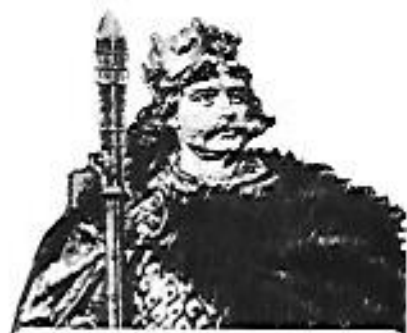
Bolesław Chrobry (*967 †1025). Pierwszy król Polski. Gospodarz zjazdu gnieźnieńskiego.