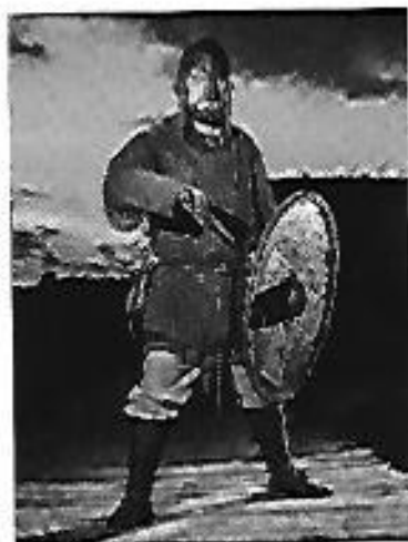
Wojowie byli doskonale wyszkoleni i uzbrojeni. Strzegli porządku w państwie i bronili go przed wrogami.

Dopiero u schyłku życia, w ostatnim roku swojego panowania – w 1025 roku – Bolesław został koronowany w Gnieźnie na króla. Tym samym Polska stała się królestwem. Wydarzenie to potwierdziło pełną niezależność państwa polskiego.