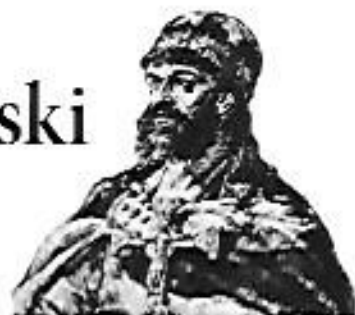
Mieszko I (około 935–992). Pierwszy historyczny władca Polski. Pochodził z dynastii Piastów.