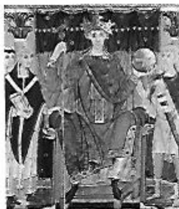
Otton III został ukazany na ilustracji z X wieku. Cesarz był przyjacielem biskupa Wojciecha. Przed wjazdem do gnieźnieńskiego grodu, na znak pokuty, zdjął obuwie i bosy ufał się do grobu świętego Wojciecha.

Spotkanie polskiego księcia z niemieckim cesarzem nazwano w historii zjazdem gnieźnieńskim . Ogłoszono wtedy decyzję papieża o utworzeniu arcybiskupstwa w Gnieźnie i trzech biskupstw – w Krakowie, we Wrocławiu i w Kołobrzegu. Było to ważne, ponieważ arcybiskup miał prawo koronowania władcy. Zjazd gnieźnieński sprawił, że wszyscy związani z cesarzem władcy Europy dowiedzieli się o istnieniu silnego, chrześcijańskiego państwa – Polski.