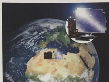
Współczesne obserwacje jednoznacznie dowodzą tezy o kulistości naszej planety.

Jedną z pierwszych hipotez na temat kulistości Ziemi sformułował Pitagoras (VI w. p.n.e.). Według niego Ziemia jako dzieło bogów musiała mieć kształt najdoskonalszej bryły geometrycznej, czyli kuli. Dowody na kulisty kształt naszej planety zebrał żyjący dwa stulecia później Arystoteles. Zaobserwował on, że cień Ziemi widoczny na Księżycu w czasie jego zaćmienia zawsze ma kształt koła. Jednak o tym, że nasza planeta ma kształt kuli, przekonała wszystkich dopiero wyprawa dowodzona przez Ferdynanda Magellana, która w latach 1519–1522 opłynęła kulę ziemską. Ponad półtora wieku po tym wydarzeniu Isaac Newton ustalił, że Ziemia jest bryłą spłaszczoną przy biegunach. Współcześnie rzeczywisty kształt naszej planety określa się mianem geoidy.